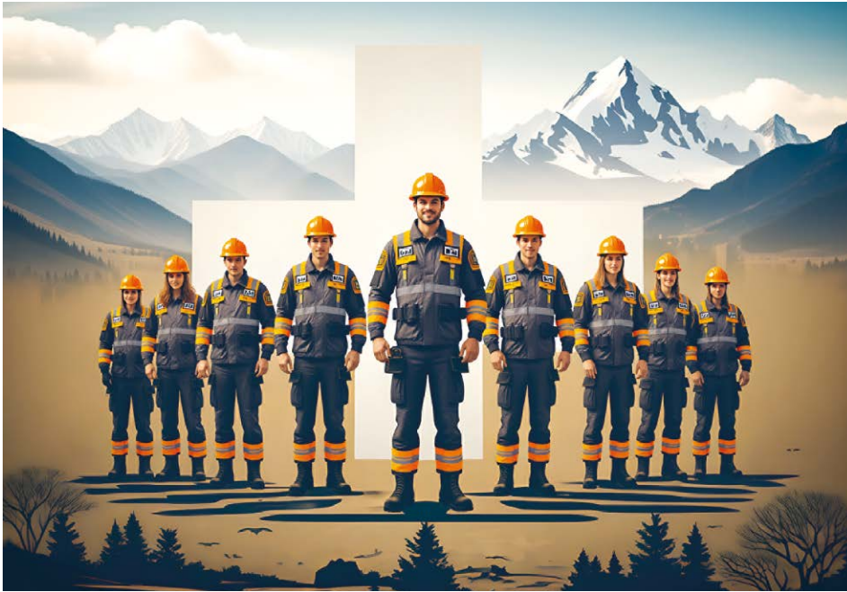
Austausch, Vernetzung und Infos aus erster Hand: Interessierte können sich für die Fachtagung anmelden.

Die Anforderungen an den Zivilschutz verändern sich rasant: Neue Bedrohungslagen, zunehmende psychische Belastungen und komplexe Einsatzszenarien verlangen nach Organisationen und Menschen, die widerstandsfähig, vernetzt und vorausschauend handeln. Genau hier setzt die Fachtagung 2026 des Schweizerischen Zivilschutzverbandes an, die am 12. Mai im Hotel Olten stattfindet.