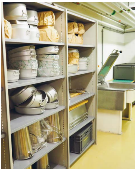
Les besoins de protection de la population reviennent au premier plan.

taires actuels et du renchérissement, le montant de la contribution de remplacement sera augmenté à 1400 francs par place protégée (non construite), selon un tarif unique. Les contributions de remplacement permettent aux cantons de financer la construction d'abris publics ainsi que les mesures de maintien de la valeur des abris privés et publics. Il est également essentiel de garantir le maintien de la valeur des constructions protégées destinées aux organes de conduite et à la protection civile (postes de commandement et postes d'attente). Les constructions protégées de plus de 40 ans encore nécessaires doivent être rénovées. Les cantons se chargent d'établir une planification des besoins selon leurs structures et leur organisation. Les constructions excédentaires doivent être réaffectées à des fins proches de la protection civile (abris publics ou abris pour biens culturels).