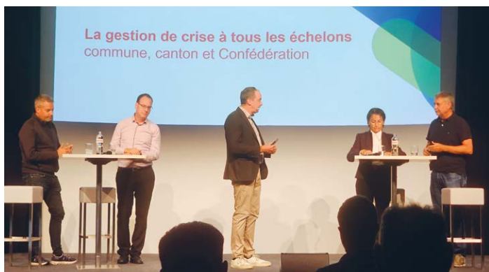
La table ronde portant sur la gestion de crise. Compétences entre communes, état et Confédération au cœur du débat.