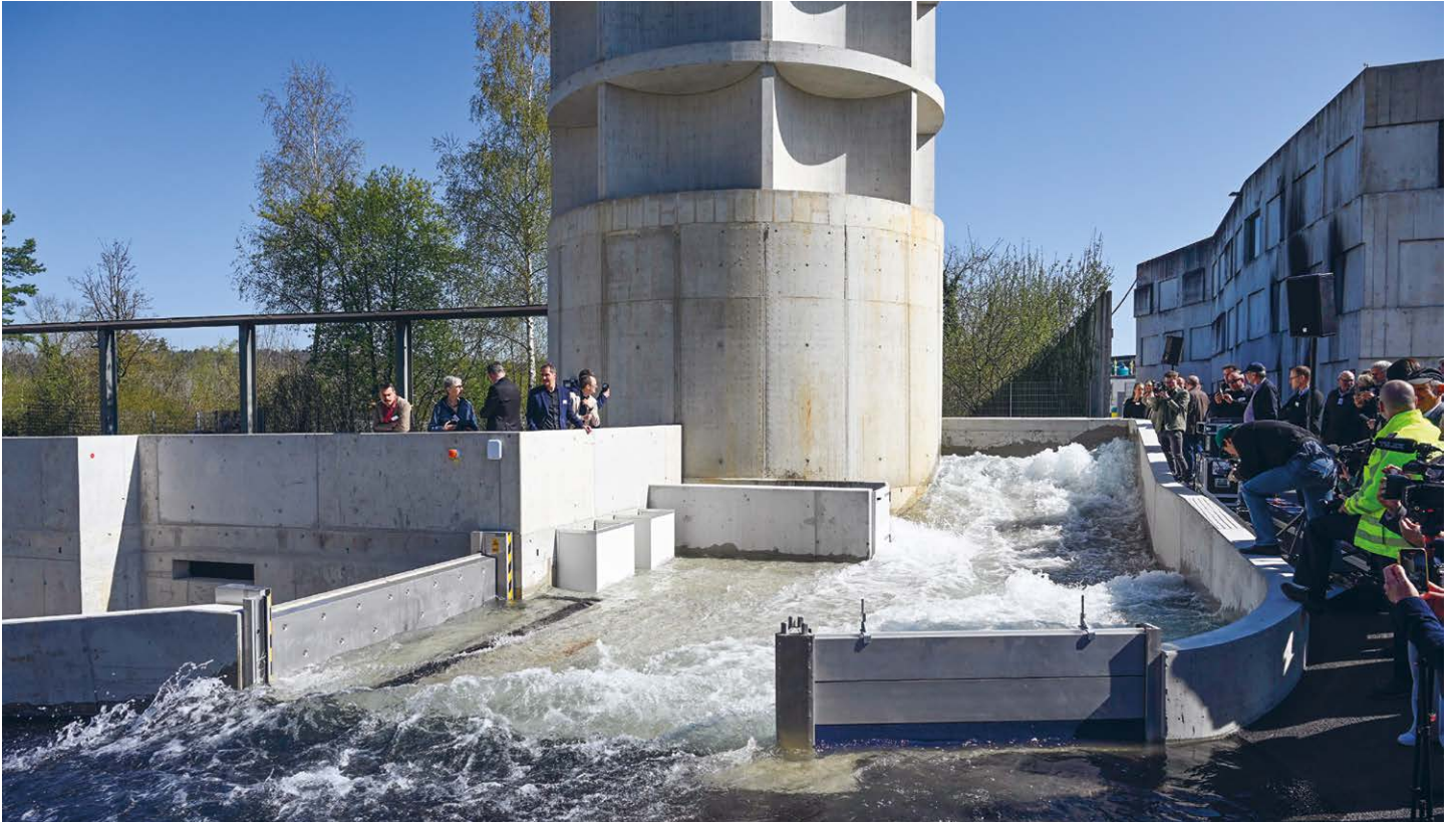
In Andelfingen steht die landesweit erste Flutungsanlage für den Bevölkerungsschutz dieser Art. Am 13. Juni dieses Jahres wird sie der Öffentlichkeit präsentiert.