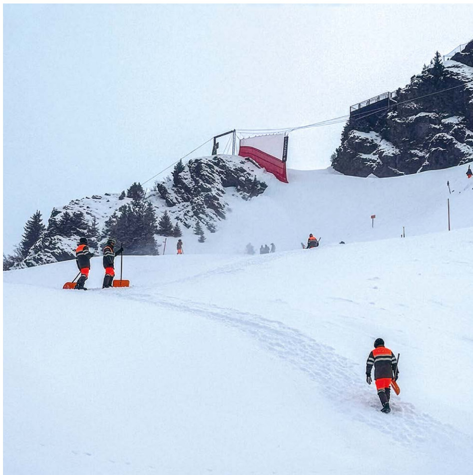
Elementar und schweisstreibend: Schneeräumung im Bereich Hundschopf und Minschkante.

Die Logistik stellt eine besondere Herausforderung dar. Viele Einrichtungen und Materialien werden nach dem Rennen direkt weiter nach Crans-Montana oder Kitzbühel transportiert. Der Abtransport erfolgt entweder per Helikopter oder mit dem Güterzug nach Lauterbrunnen. Dies sind die einzigen