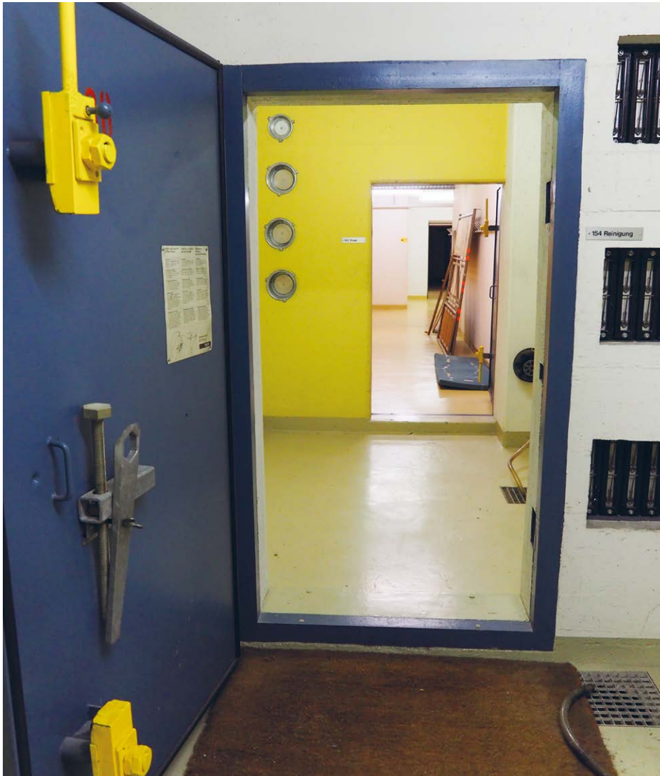
Das Prinzip des Kollektivschutzes gilt unvermindert: Jeder Einwohnerin und jedem Einwohner ein Schutzplatz in der Nähe des Wohnortes.

rig, noch benötigte Schutzanlagen sollen erneuert werden. Die Kantone haben basierend auf ihren strukturellen und organisatorischen Voraussetzungen eine Bedarfsplanung zu erstellen. Überzählige Schutzanlagen sollen für zivilschutznahe Zwecke umgenutzt werden, zum Beispiel als öffentliche Schutzräume oder Kulturgüterschutzräume.